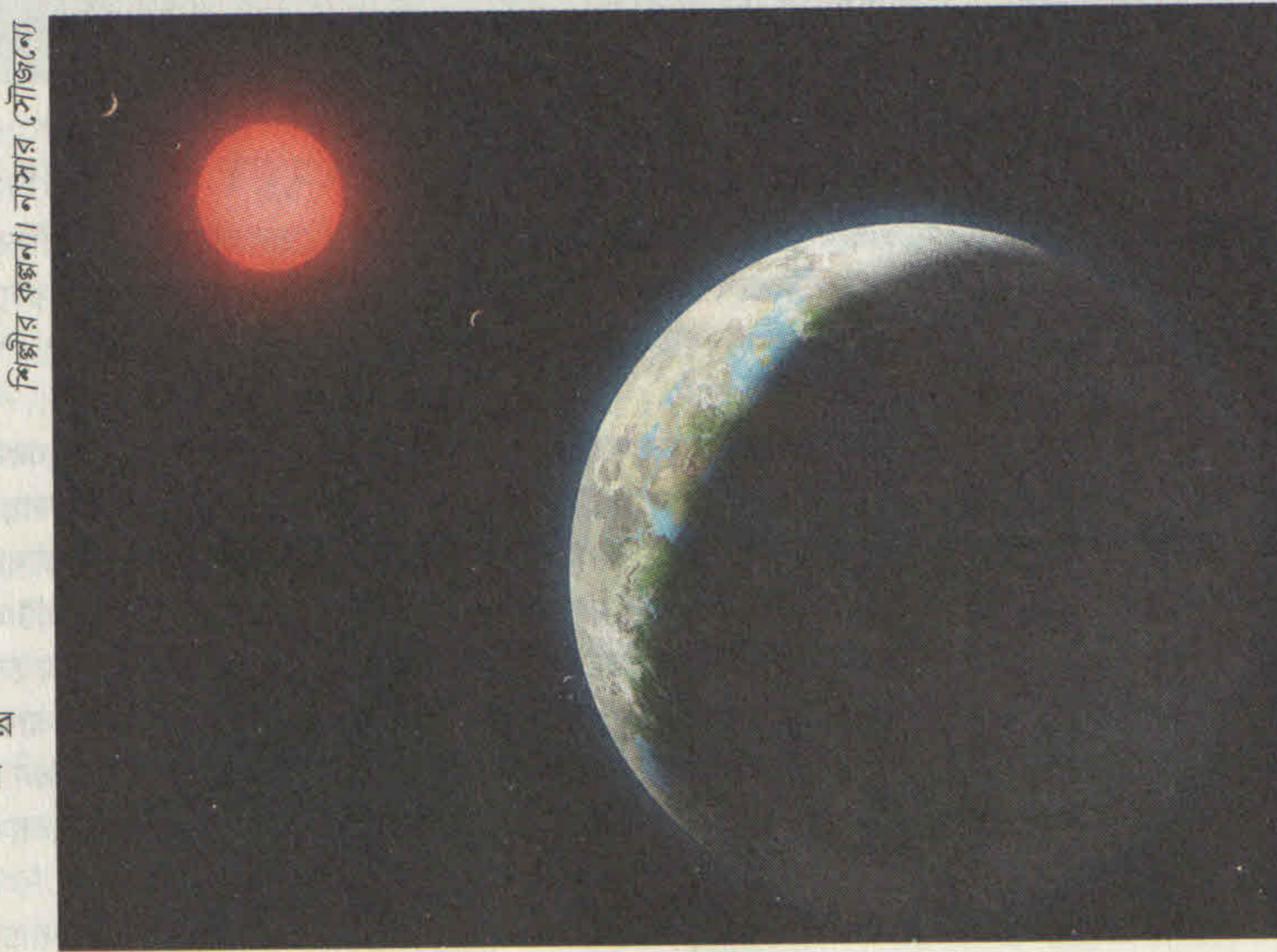
শিল্পীর কল্পনা।

GJ581g ডাকনাম জার্মিনা। পৃথিবীসদৃশ গ্রহদের অন্যতম