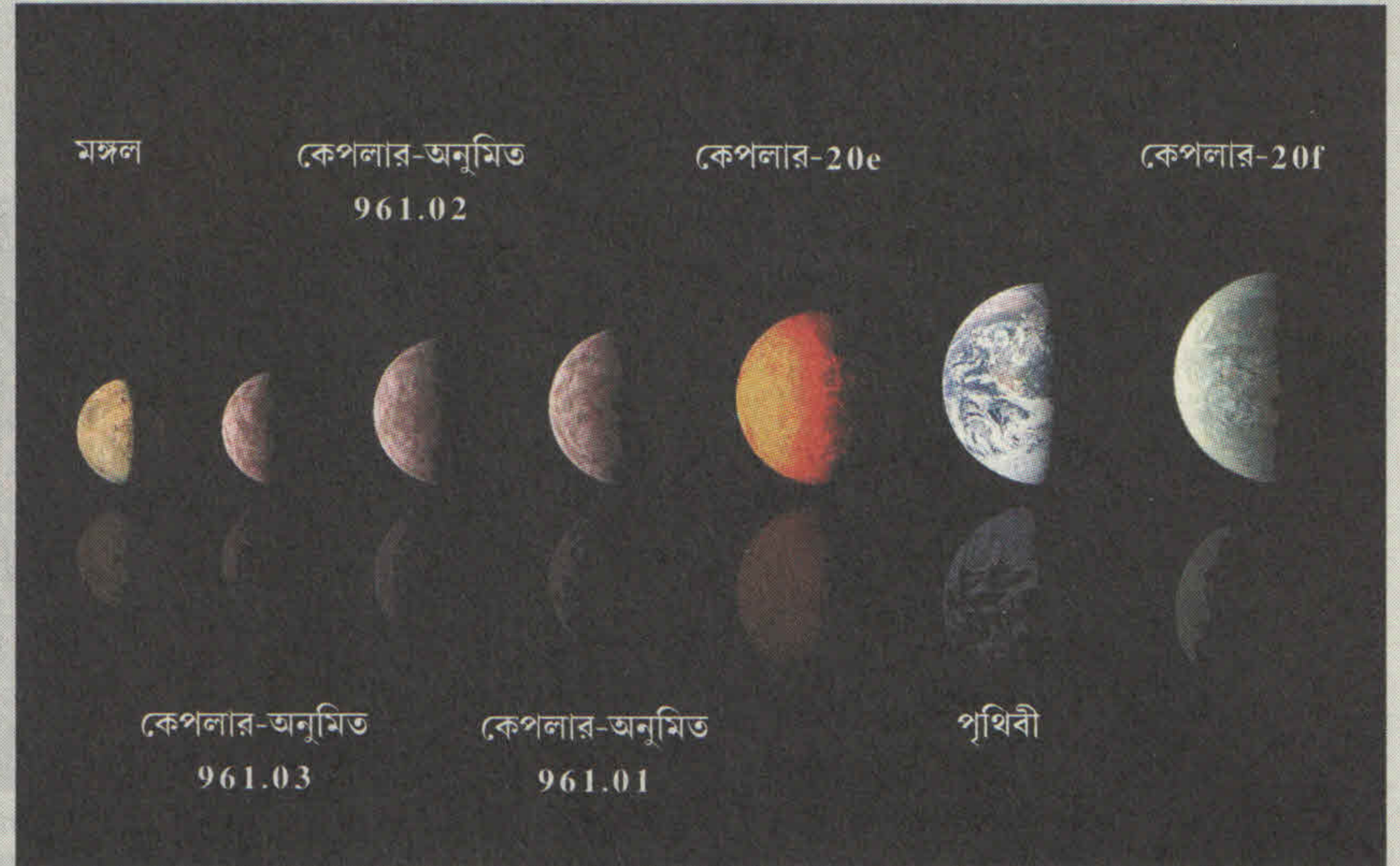
কেপলার দূরবিনে শনাক্ত করা ভিন-সূর্যের পরিবারের কয়েকটি গ্রহের সঙ্গে সৌর গ্রহদের আয়তনের তুলনা।

ক্যাপ্টেন জেকবের মাথায় এই চিন্তাটাই খেলেছিল যে, দেখা না গেলেও মহাকর্ষের টানে আপাত-অদৃশ্য কোনও বস্তুর অস্তিত্ব জানা যেতে পারে। তবে ইউরেনাসের ওপর নেপচুন