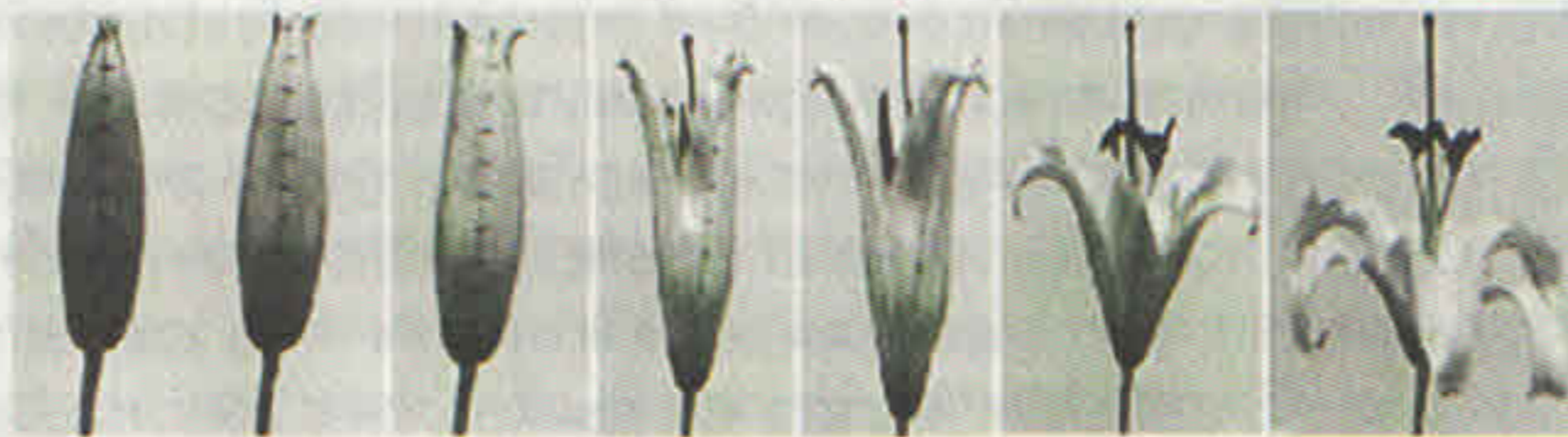
ধীরে ধীরে ফুল ফুটছে

কোন ধরনের পাপড়ি কত তাড়াতাড়ি ফুটে উঠবে। এইসব বিষয় এখন সহজেই পরীক্ষা করে নেওয়া যাবে, এবং বিজ্ঞানীরা বিভিন্ন ফুল ফোটার হার মেপে এই তত্ত্বের যথার্থ্য নির্ধারণ করতে পারবেন। অবশ্য এই অসমান হার বজায় রাখার জন্য রাসায়নিক স্তরে কী হচ্ছে বা কোষের ভেতরে কোন জিন-এর জন্য এমনটা ঘটে, সেটা এখনও অজানা রয়ে গেছে। তবে প্রাণিজগতের ঘটনার সঙ্গে পদার্থবিজ্ঞানের বা গণিতের যোগসূত্রগুলো যে আজকাল ক্রমশ প্রতীয়মান হয়ে উঠছে, এই গবেষণা তারই একটা উদাহরণ। এই গবেষণা এটাই প্রমাণ করে যে, প্রাণিজগতের সব ধরনের ঘটনার পিছনেই যে জিনের প্রভাবকে টেনে আনতে হবে, তেমন কোনও কথা নেই। পদার্থের বৈশিষ্ট্যও প্রাণিজগতের বিভিন্ন জিনিসের আকার