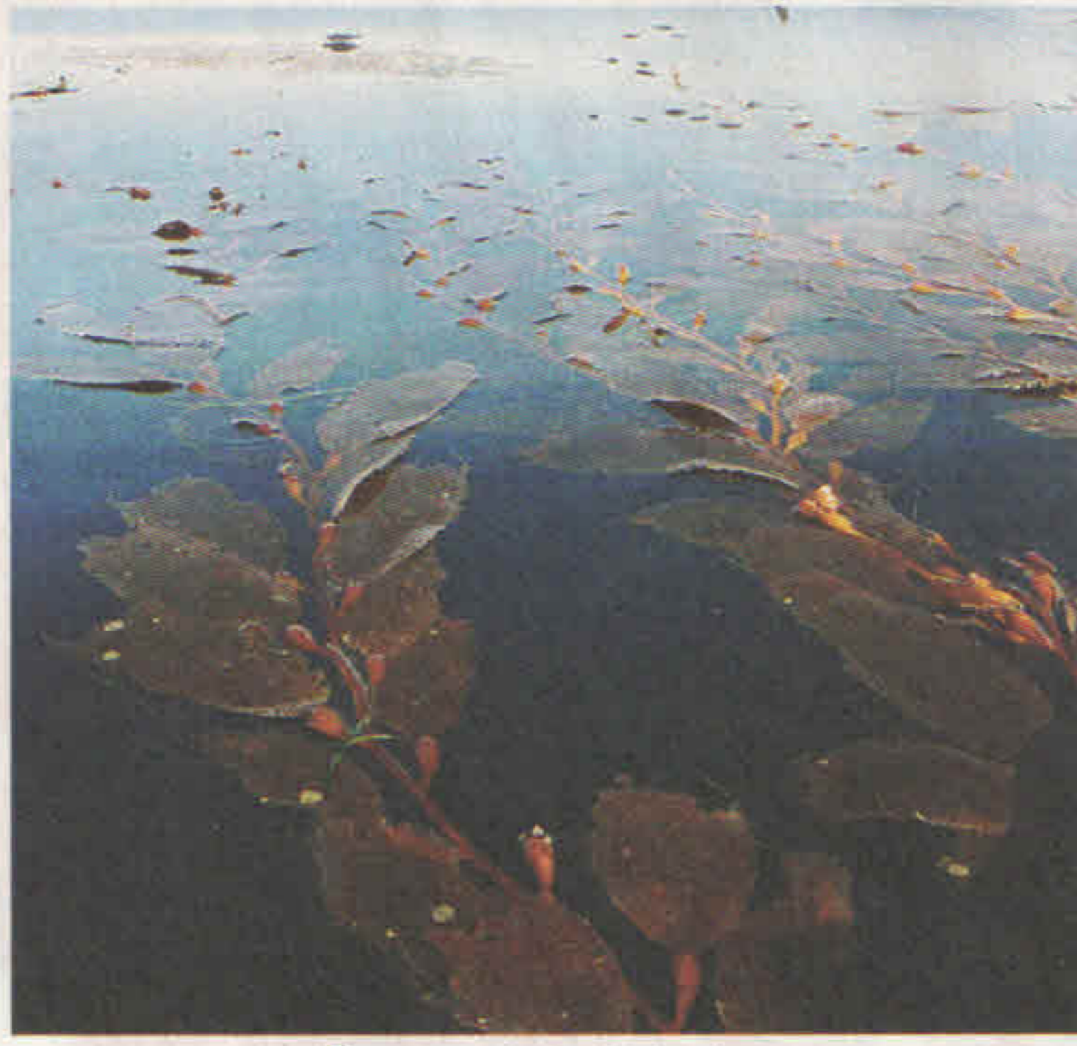
স্থির জলে ভাসমান পাতার গড়ন

পাপড়ির বিভিন্ন অংশের বৃদ্ধির হার মাপার জন্য বিজ্ঞানীরা তার ওপর কালো কালি দিয়ে সমান দূরত্বে পর পর কয়েকটি বিন্দু এঁকে দেন, কয়েকটা তার মধ্যশিরার ওপর এবং