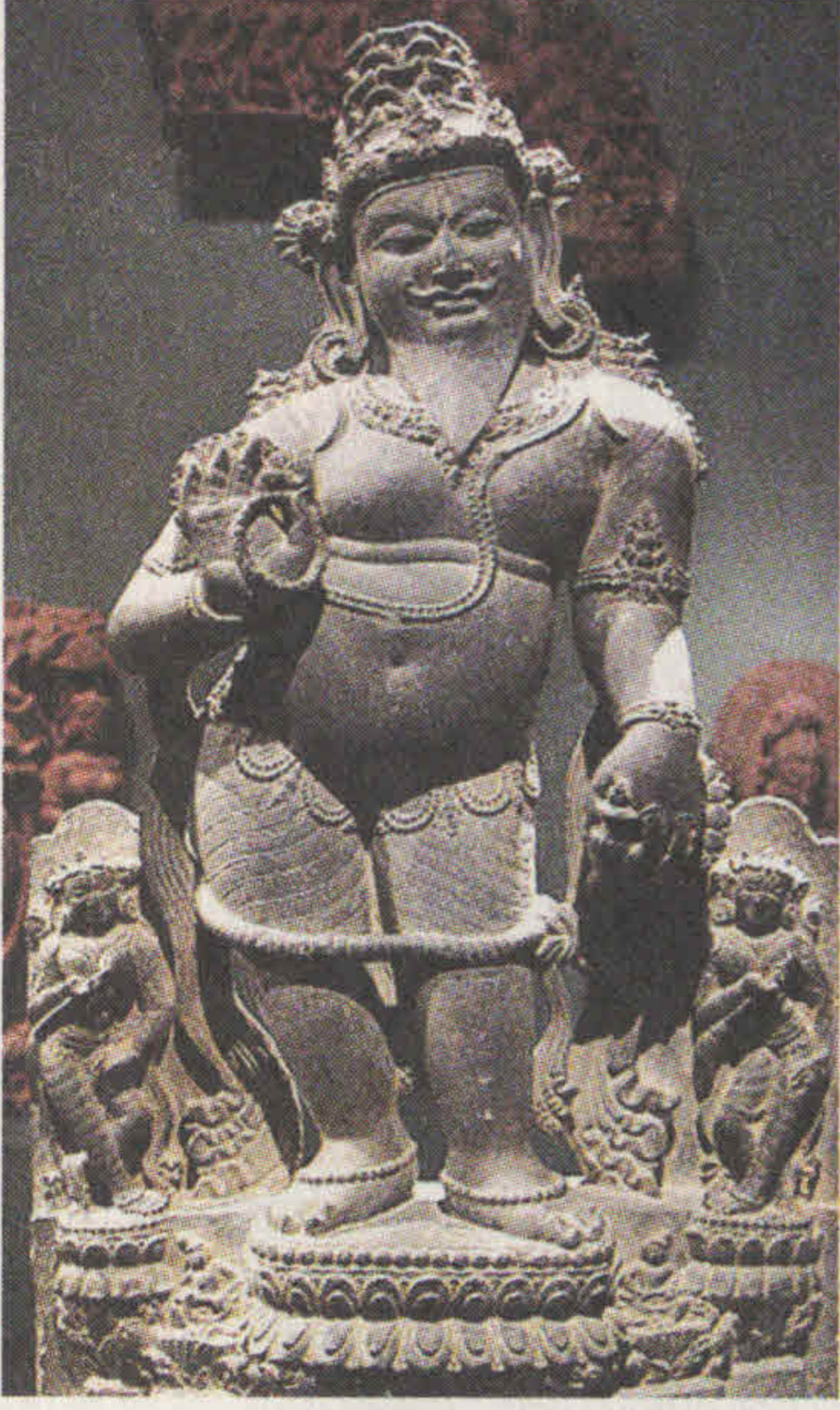
দ্বাবিংশ শতাব্দীতে তৈরি অগস্ত্য মূর্তি

বিহিত করতে। অগস্ত্য এসে স্বচক্ষে দেখে বিদ্যাপর্বতকে বললেন যে তাঁকে দাক্ষিণাত্যে যেতে হবে, এবং সে যেন তাঁকে যেতে দেয়। অগস্ত্যমূর্তির কথায় ভয় পেয়ে বিদ্যাপর্বত মস্তকানত করে তাঁর যাওয়ার জন্য পথ করে দিল। অগস্ত্য যাওয়ার সময় বলে দিয়েছিলেন যে যতদিন না তিনি ফিরে আসছেন ততদিন যেন বিদ্যাচল এইভাবেই তার মাথা নিচু করে রাখে। সেই থেকে সূর্যের পথ আর আবদ্ধ রইল না, ধরা প্রলয় থেকে বাঁচল।