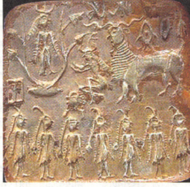
মহেঞ্জোদারো থেকে পাওয়া সিলমোহর

আমরা সবাই জানি যে, পৃথিবীর উত্তর আর দক্ষিণ মেরুর মধ্য দিয়ে যে-অক্ষরেখা কল্পনা করা হয় সেটা আকাশে ধ্রুবতারার দিকে তাক করে আছে। আসলে এমনটা সব সময় ছিল না, কারণ এই অক্ষরেখাটি স্থির নয়। এই অক্ষরেখা খুব ধীরে ধীরে লাটিমের মতো ঘুরছে। এত ধীরে যে, একবার পুরো ঘুরে আসতে তার ২৬০০০ বছর লেগে যায়। আর এর ফলে আমাদের বৎসর গণনায় একটু গোলমাল হয়—যার পরিমাণ বছরের ২৬০০০ ভাগের এক ভাগ, অর্থাৎ প্রায় ২০ মিনিটের মতো। এটা খুব কম মনে হতে পারে, কিন্তু এই সামান্য ভুল ৬০ বছরের শেষে প্রায় একটা পুরো দিনের ভুল হয়ে দাঁড়ায়। আর দেড় হাজার বছর ধরে—সিদ্ধান্ত যুগের পর থেকে আজ পর্যন্ত—এই ভুল ক্রমশ বাড়তে বাড়তে এখন ২৪ দিনের তফাতে