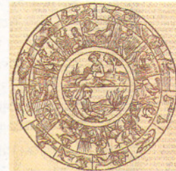
কৃষিসংস্কৃতিতে জড়ানো রাশিচক্র

শুরু করা যাক দুই-তিন হাজার বছর পিছিয়ে গিয়ে। বছরের সংজ্ঞা হল, সূর্যের চারিদিকে পৃথিবীর একবার ঘুরে আসা। এই সময়ের মধ্যে যে কোনও একটা দিন থেকেই বৎসর গণনা শুরু করা যেতে পারে। কিন্তু বছরের সব দিন সমান নয়। বছরের চারটে বিশেষ দিন অন্যান্য দিনের চেয়ে বেশি তাৎপর্যপূর্ণ। পৃথিবীর উত্তর-দক্ষিণের অক্ষরেখা তার সূর্যের চারিদিকে যে কক্ষপথে সে ঘোরে, তার ওপর খানিকটা হেলে রয়েছে। এই হেলে থাকার জন্যই পৃথিবীতে ঋতু বদলায়। কখনও দিন খুব দীর্ঘ হয়, কখনও রাত। এই সূত্রেই পাই চারটে বিশেষ দিন: উত্তর গোলার্ধের সাপেক্ষে ভাবলে, যেদিন দিবাভাগ সবচেয়ে দীর্ঘ (২২ জুন), যেদিন রাত সবচেয়ে