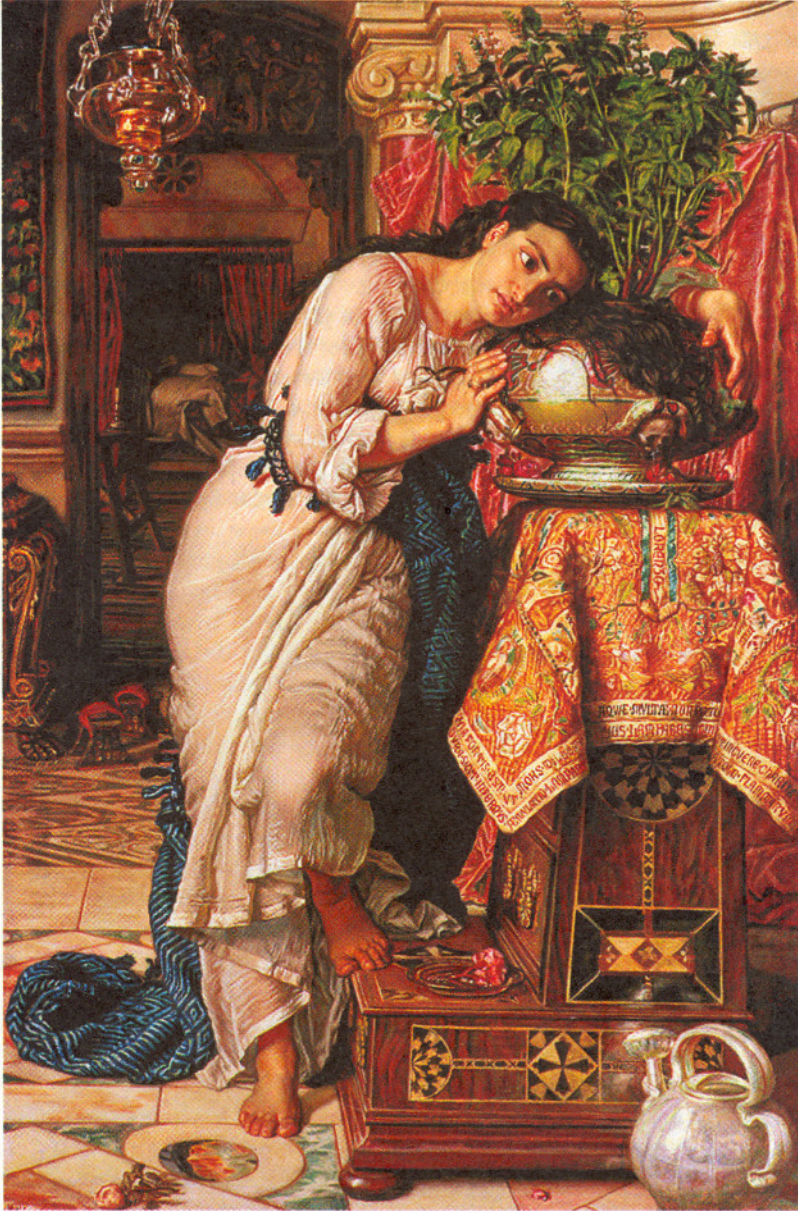
‘ইসাবেলা অ্যান্ড বেসিল’, উইলিয়াম হাটের আঁকা ছবিতে ভুলে যাওয়া প্রথার ছায়া

আমরা যদিও গরমে ঘামতে ঘামতে নববর্ষের আয়োজন করি, এমনটা কিন্তু সবসময় ছিল না। খুব সম্ভবত এক সময়ে আমাদের দেশে নববর্ষ পালন করা হত শরৎ-হেমন্তে। বছরের ওই সময়টাতে আকাশ-বাতাস যেমন উৎসবের মেজাজে মুখর হয়ে থাকে, তেমন আর অন্য কোনও সময়ে থাকে না। সেই প্রাচীন নববর্ষের উৎসবের কিছু রেশ এখনও রয়ে গেছে। যেমন অগ্রহায়ণ মাসের নামটা। ‘অয়ন’ বলতে এক বৎসর বোঝায়, আর ‘অগ্র’ দিয়ে সেই মাসকে বোঝায় যেটা বছরের সবচেয়ে প্রথমে আসে। অর্থাৎ এই মাস দিয়েই এক সময় আমাদের বছর শুরু হত। এই প্রথা আর তার রূপান্তরের একটা ইতিহাস আছে, যা গোয়েন্দাকাহিনির মতো রোমাঞ্চকর, একদিকে বীভৎস অপর দিকে রমণীয়, যা লিখতে টেনে আনতে হবে আকাশের নক্ষত্র থেকে সিঙ্কসভাতার সিলমোহর থেকে আমাদের আঙিনার তুলসীমঞ্চটিকেও।