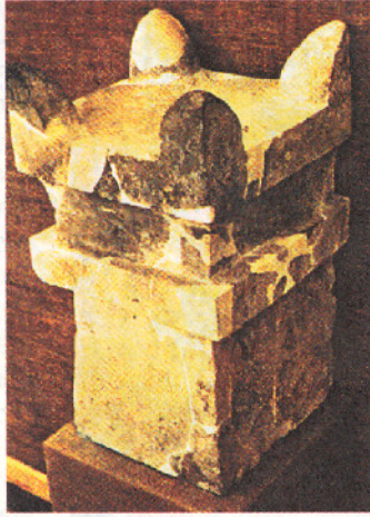
ভারতীয় তুলসীমঞ্চ (বাদিকে) এবং প্রাচীন ইজরায়েলের উৎসর্গবেদী

অনুযায়ী। এই ‘বেদাঙ্গ জ্যোতিষ’-এর নিয়ম মেনে ভারতের বৈদিক যুগে অগ্রহায়ণ থেকে বৎসর গণনা শুরু হত। কয়েকজন ইতিহাসবিদের মতে তারও আগে, সিদ্ধু সভ্যতার সময়ও এই অগ্রহায়ণ মাসেই নববর্ষের উৎসব পালন করা হত।